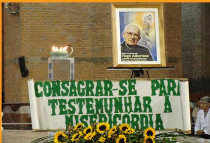
1º Dia Paulino, em 26 de novembro, Seminário dos Padres e Irmãos Paulinos - Cidade Paulina. Tema: A Família Paulina: uma história para contemplar! “Não temas, eu estou convosco”