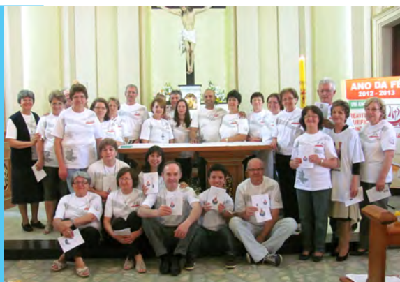
Grupo dos Cooperadores Paulinos Amigos de Jesus Bom Pastor – Caxias do Sul/RS