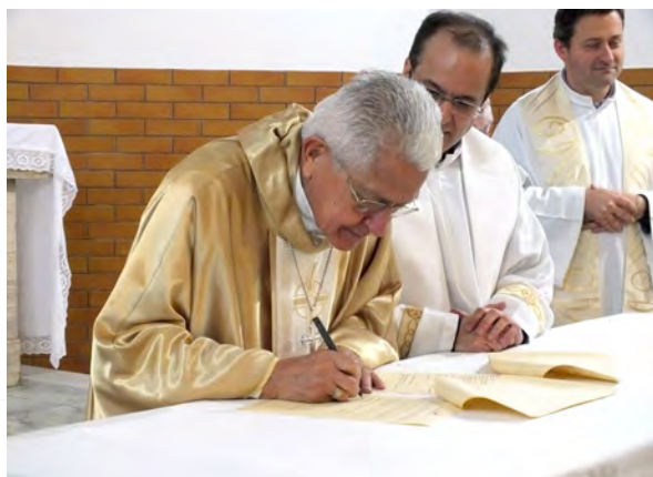
Dom Angélico faz a Primeira Profissão no Instituto Jesus Sacerdote.