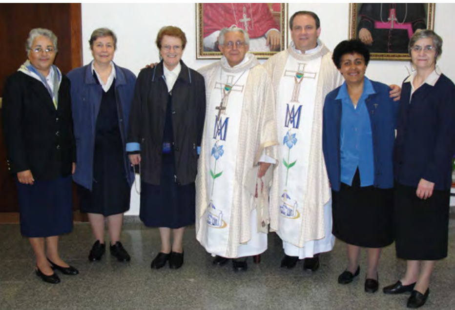
Primeira Peregrinação ao Santuário de Nossa Senhora Aparecida – Aparecida/SP