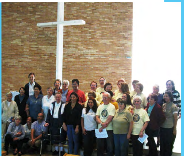
Grupo dos Cooperadores Paulinos Amigos de Jesus Bom Pastor – São Paulo/SP