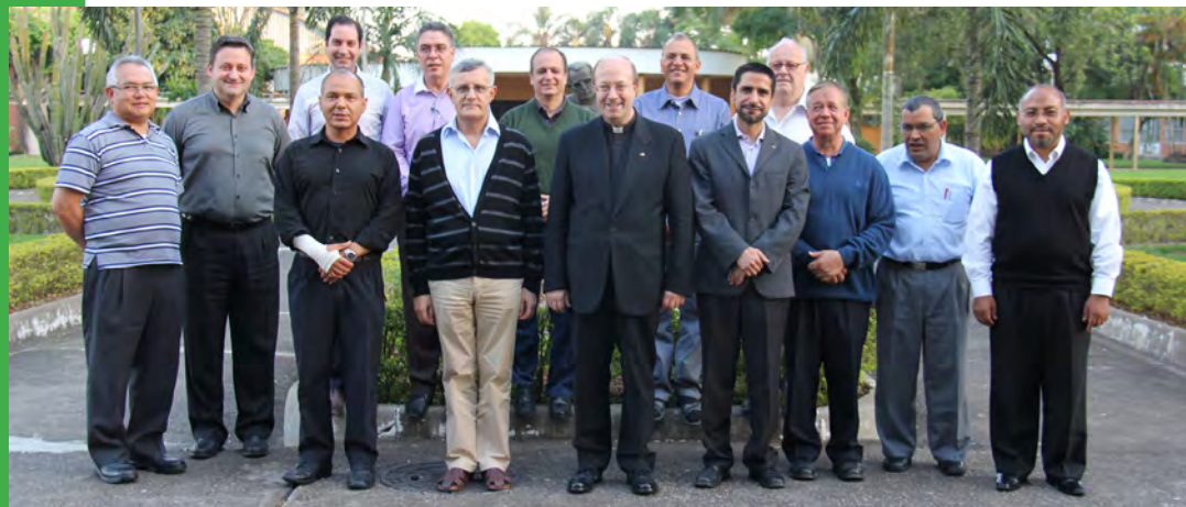
Participantes da IX Assembleia do CIDEP